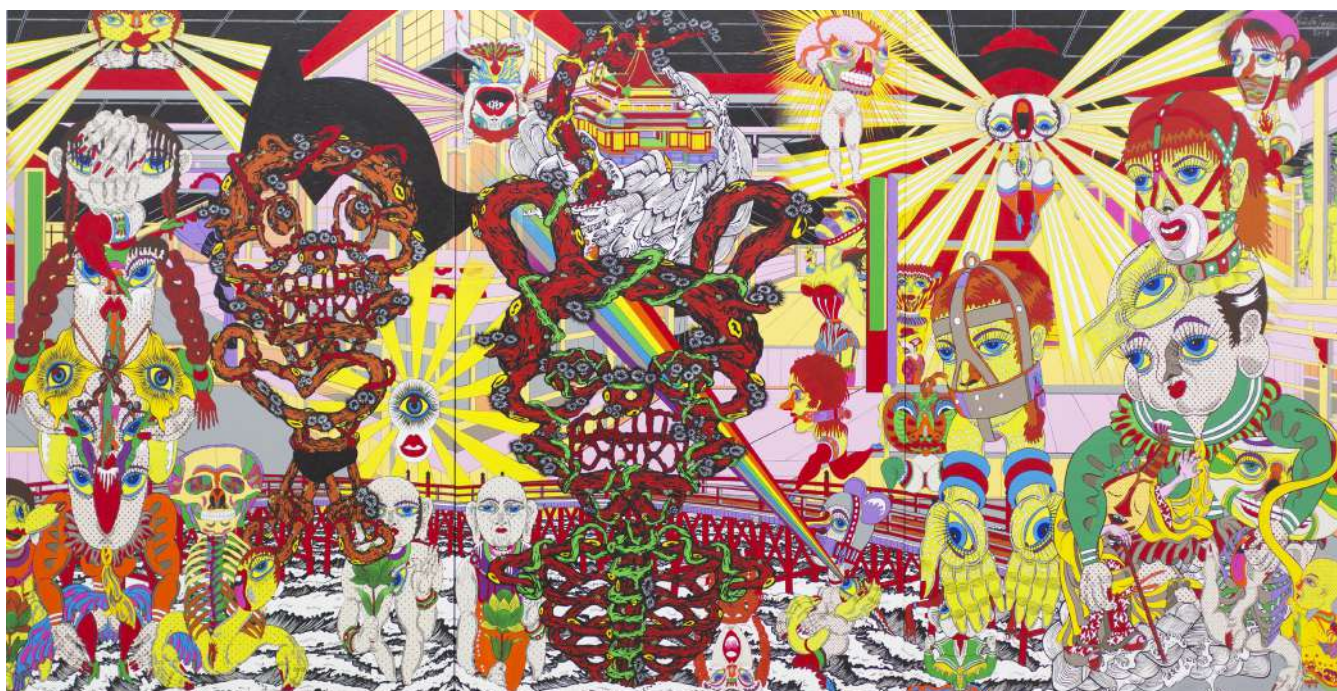
©Keiichi Tanaami Courtesy of the artist and NANZUKA (Partie 6)