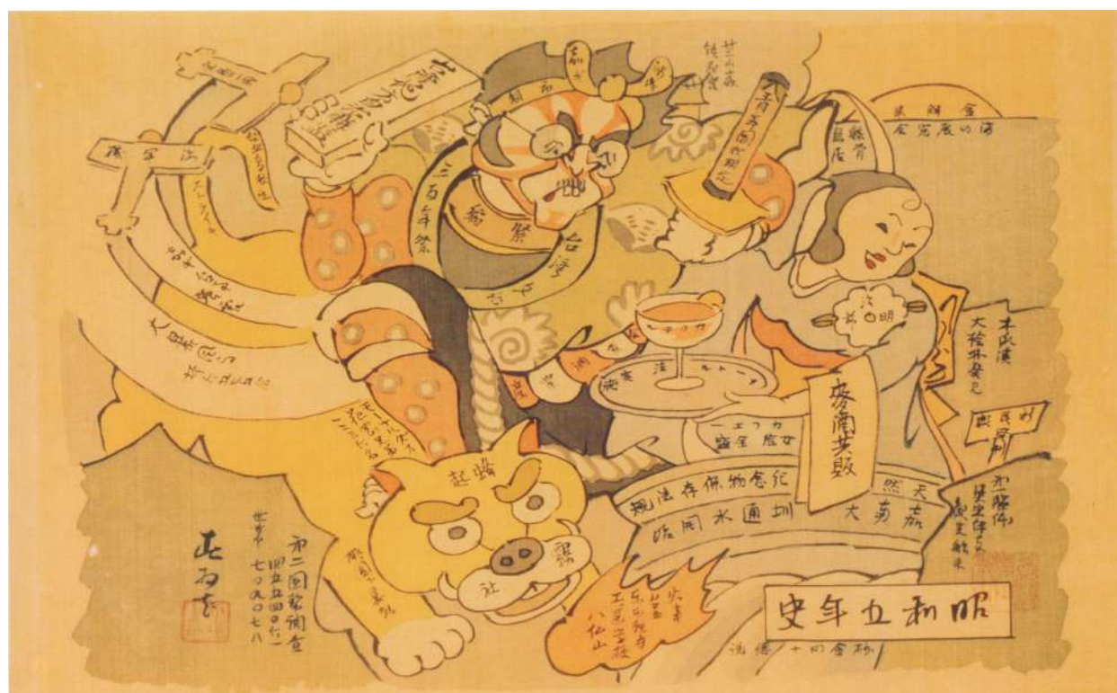
History of Taiwan, Kunishima, © Avanguard publishing (Patrie 3)