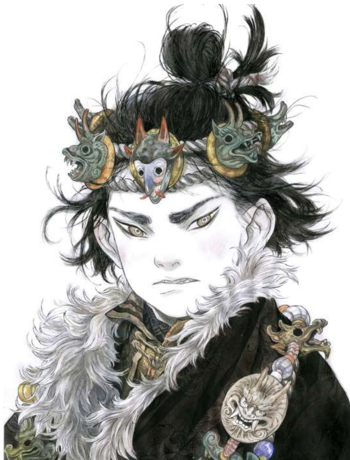
Du Gu, Zao Dao, 2014, character design for "Le Vent traversant les pins". Published by Editions Mosquito, 2015 (Partie 2)